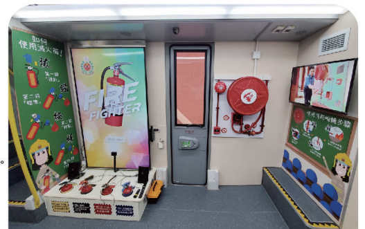
● 巴士下層的互動遊戲設備。

新教育巴士設有有趣的互動遊戲及嶄新的科技，提高市民對應急準備教育的認識。巴士上下兩層分別設有兩個推廣「應急三識」的活動區。下層活動區主題為「識滅火」，設有「識滅火」互動遊戲，參加者需要運用滅火筒的使用口訣「拔、瞄、按、掃」和消防喉轆的使用口訣「破、轉、拉、射」來完成。至於上層活動區主題則為「識逃生」及「識自救」，活動區引入全新VR虛擬實景遊戲，透過火警現場的虛擬實景去教導市民如何逃生和自救。