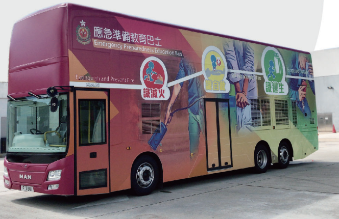
● 全新的巴士車身外觀。

消防處一向對推動消防安全教育不遺餘力，希望能夠提高市民的消防安全意識，防患於未然。本處第一輛流動宣傳車於2002年面世，十多年來穿梭香港不同地方作宣傳；而取代之繼續為市民提供宣傳及應急準備教育服務的，將會是全新的應急準備教育巴士。