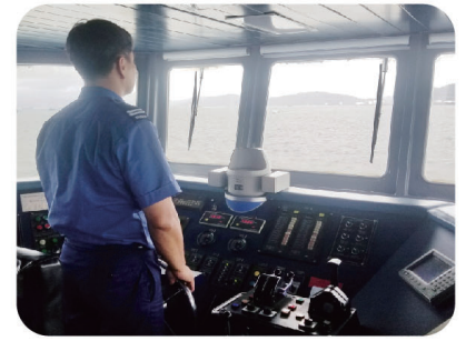
● 卓越號滅火輪舵手運用船藝配合直升機的拯救行動。

於整個演習過程中，各人員包括船長、舵手、瞭望員、雷達員及機房人員均各司其職，通力合作，發揮長年建立的默契，結合多年的航海船藝訓練，令演習順利完成。