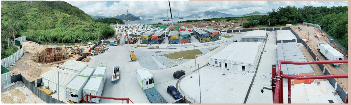
● 竹篙灣興建臨時檢疫設施。

因應「2019冠狀病毒病」的疫情，政府2月初決定在竹篙灣興建臨時檢疫設施，並隨即動工。