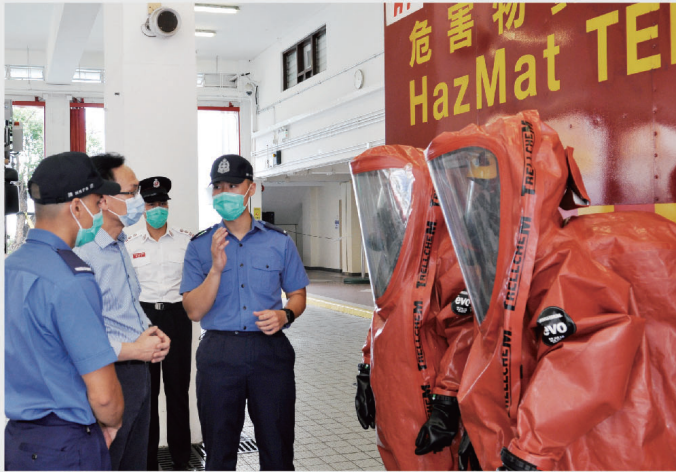
● 公務員事務局局長聶德權聽取有關危害物質專隊和危害物質處理車的簡介。