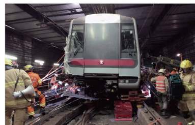
● 坍塌搜救專隊處理偏離軌軌的港鐵列車車廂。