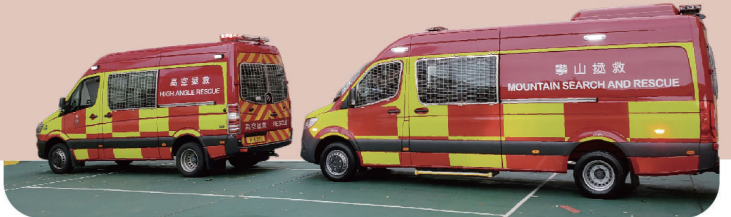
● 新引入的攀山拯救支援車較現役的高空拯救專隊支援車長超過一米，大大提升空間和運載能力。

全新攀山拯救專隊支援車已於5月11日正式投入服務。在未來的日子，消防處工程組會繼續加強與前線和不同持份者的溝通，積極引入新型號和車種，進一步提升行動效率。