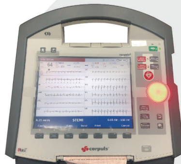
● 十二導程心電圖先導計劃配備的除顫監護儀。

隨着先導計劃順利完成，在部門與醫院管理局緊密合作下，除顫監護儀已於九龍分區各救護站開始試用。