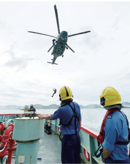
● 直升機吊運救援人員到卓越號滅火輪進行拯救行動。

青衣滅火輪消防局的卓越號滅火輪聯同政府飛行服務隊，於5月22日在南丫島西北對開海面進行了一次海上拯救演習，以加強兩個部門的合作及溝通，確保一旦遇到海上緊急事故時，能夠作出迅速及有效的拯救行動。