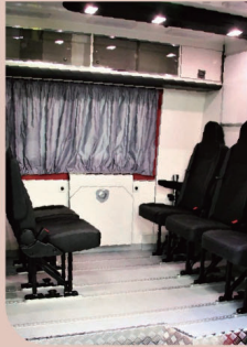
(按需要加減座位的數目和更改方向)

為配合攀山拯救專隊靈活機動的工作需要，消防處工程組為攀山拯救專隊設計、採購及引進新款的攀山拯救支援車，以供拯救和行動之用。新車與使用中的高空拯救專隊支援車，同樣是以大型客貨車改裝而成，並由波蘭的車身建造商負責建造，車身更增長超過一米，大大提升了車廂內的可使用空間和運載能力。新車配備最新的環保歐盟六型引擎，最高馬力更可達到190匹，亦特別配置多項原廠安全裝置，使行車更加安全。