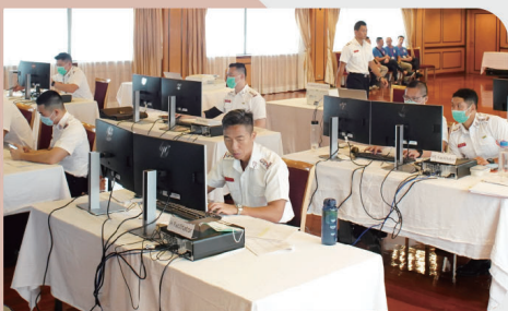
● 負責協助設計及帶領「孤影」反恐桌上演練的屬員，發放不同的預設及加插情境，增加演練的互動及真實性。

各單位在演練中均發揮其職能，就各種突發事故迅速作出反應，展現本處屬員時刻準備應對各種挑戰的能力及專業精神。