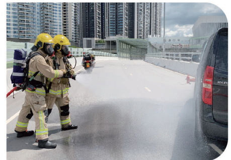
● 消防人員於演練中進行滅火及救援工作。

次日的演練則模擬管制站旅檢大樓二樓的入境大堂發生火警，有旅客受傷被困。消防及救護人員抵達現場後立刻展開滅火及救援行動，同一時間，旅檢大樓職員疏散大樓內的旅客和其他職員到緊急集合點，再交由海關和入境處職員完成相關的清關及出入境手續。